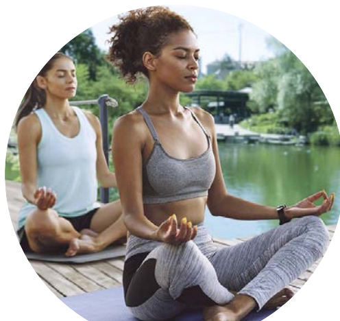
Park im Grünen

Nach dem Kneten bleibt er noch eine Weile liegen, bevor ihn die Bäckerinnen und Bäcker portionieren. Nachdem sich die Teigstücke im Gärraum weiter entfaltet haben, werden sie flach gedrückt und mit den Zutaten belegt. Nach weiteren 20 Minuten, während denen der Teig noch einmal schön aufgehen kann, kommen die Focacce in den Ofen. Die Kundinnen und Kunden finden die neue Spezialität der Migros Basel noch warm und herrlich duftend, täglich frisch und handgemacht in den Regalen der Filialen mit einer eigenen Hausbäckerei - ausser in Porrentruy. Der Sommer kann kommen.