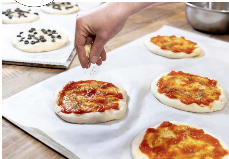
Auf den geformten und mit Tomatenbelag bestrichenen Teig kommt der Käse (oben); die zwei Varianten auf dem Backblech (rechts)